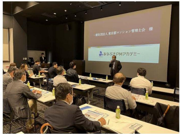
事前勉強会のようす