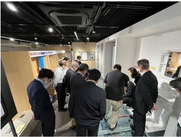
見学のようす (給排水設備)

研修案内の発出後、翌日には定員に達するという盛況ぶりが認められる研修会となりました。