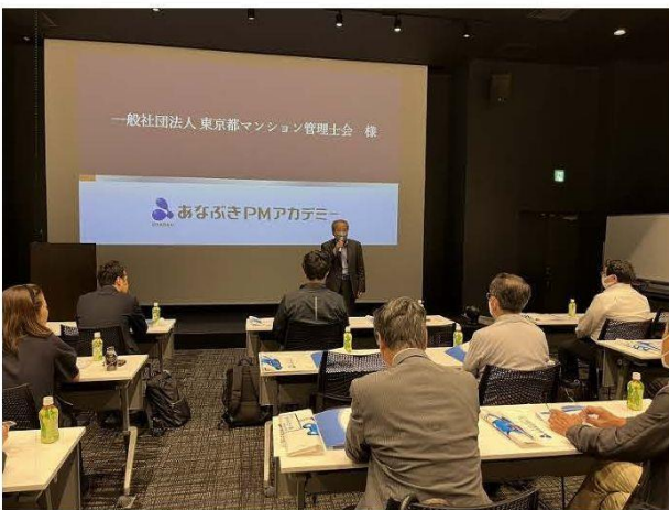
事前勉強会のようす